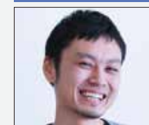
クリエイティブディレクター 佐藤 可士和