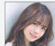
モテクリエイター 菅本 裕子 (ゆうこす)