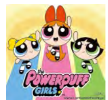
TM & © Cartoon Network.(s16)