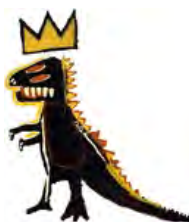
©The Estate of Jean-Michel Basquiat. Licensed by Artstar, New York.